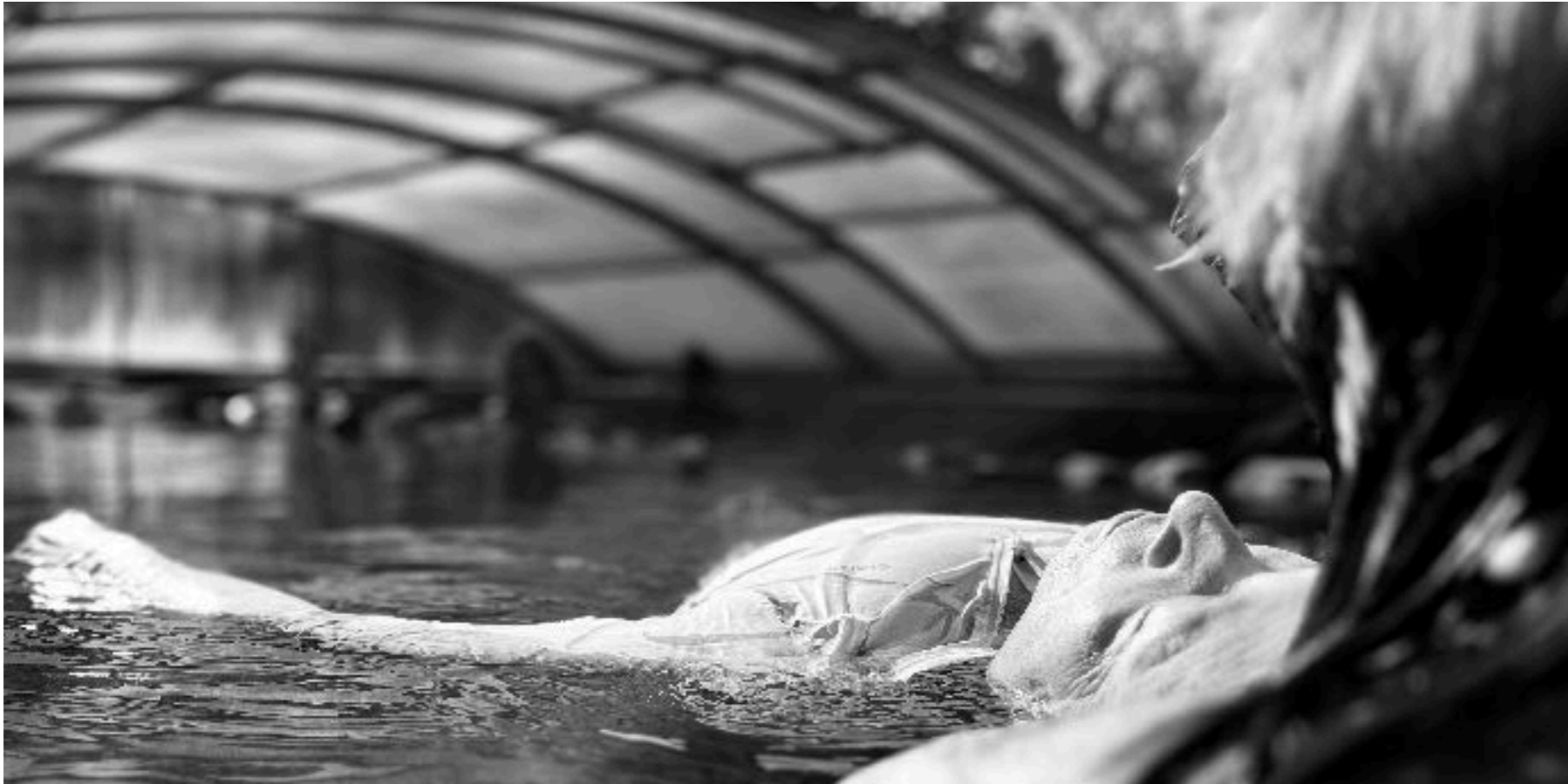
Dynamique stillness, aquatic fulcrum, et état modifié de conscience

En ostéopathie, écouter, regarder et toucher un patient nous renseigne sur ce qui a créé son état . L'expression de cet état renseigne notre diagnostic . Alors s'invite le processus de créativité, de traitement qui entreprend de modifier l'état.