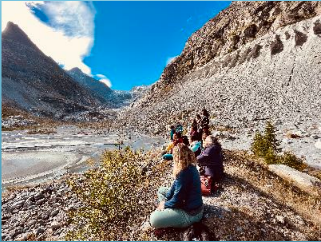
Suisse ( www.tinika.ch )