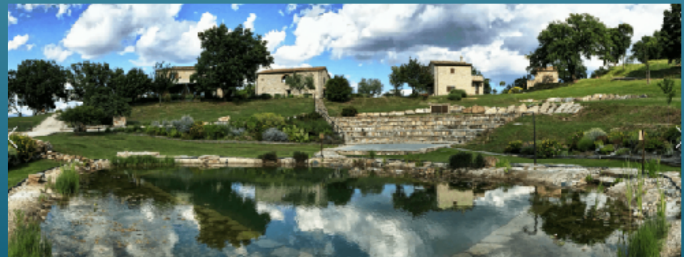
Italie ( http://www.sassetaalta.it )