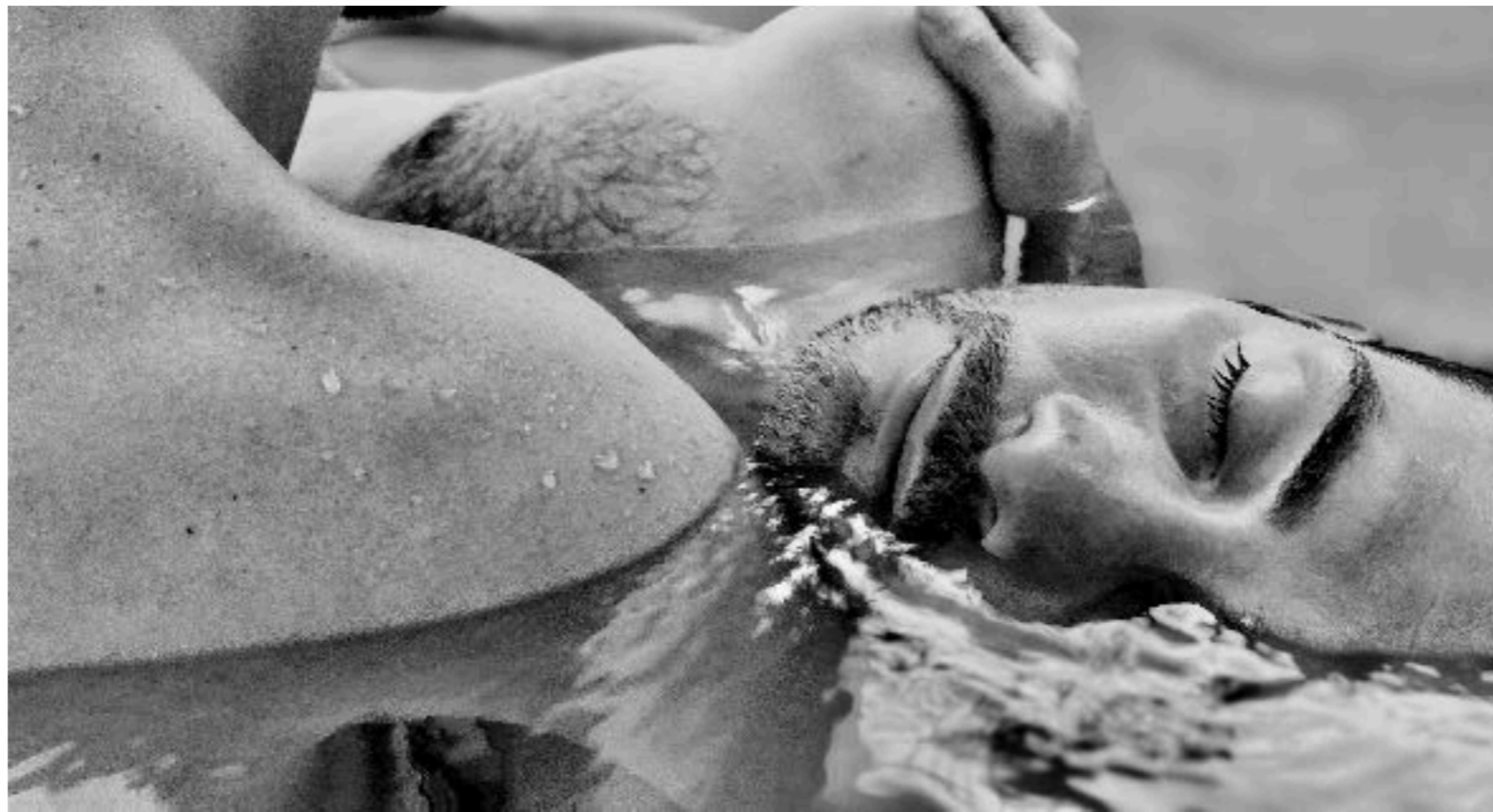
Dynamique stillness, aquatic fulcrum, et état modifié de conscience

En ostéopathie, écouter, regarder et toucher un patient nous renseigne sur ce qui a créé son état . L'expression de cet état renseigne notre diagnostic . Alors s'invite le processus de créativité, de traitement qui entreprend de modifier l'état.