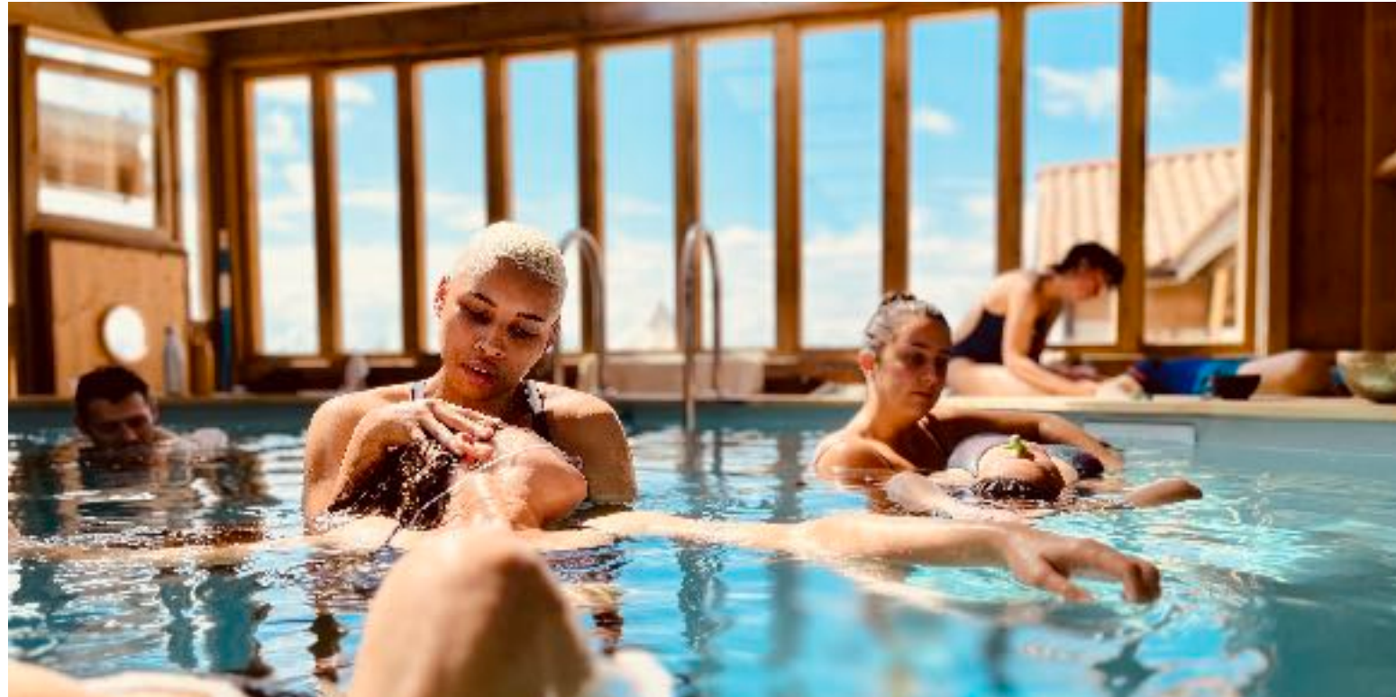
Dynamique stillness, aquatic fulcrum, et état modifié de conscience

En ostéopathie , écouter, regarder et toucher un patient nous renseigne sur ce qui a créé son état . L'expression de cet état renseigne notre diagnostic . Alors s'invite le processus de créativité, de traitement qui entreprend de modifier l'état.