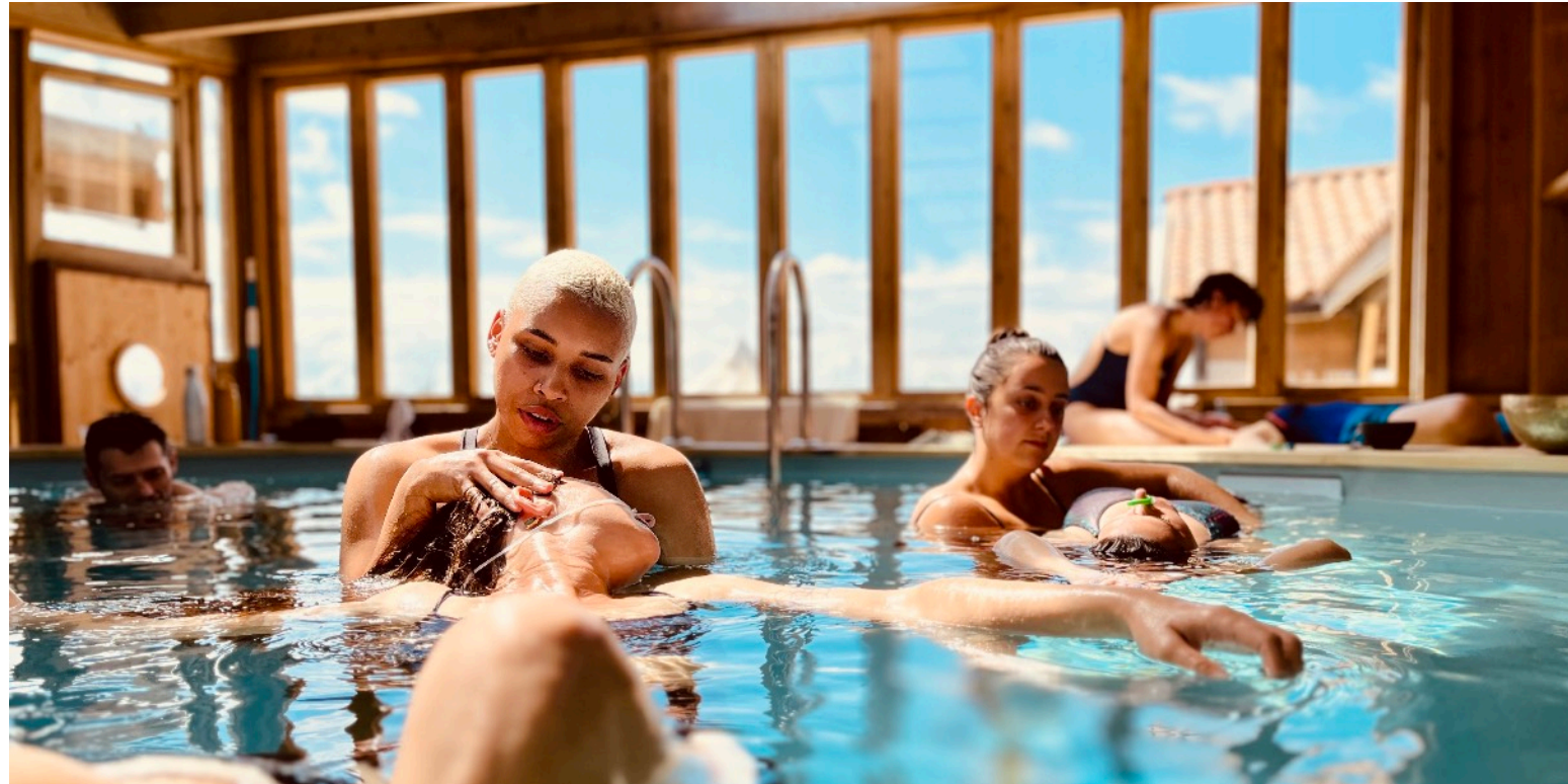
Dynamique stillness, aquatic fulcrum, et état modifié de conscience

En ostéopathie , écouter, regarder et toucher un patient nous renseigne sur ce qui a créé son état . L'expression de cet état renseigne notre diagnostic . Alors s'invite le processus de créativité, de traitement qui entreprend de modifier l'état.