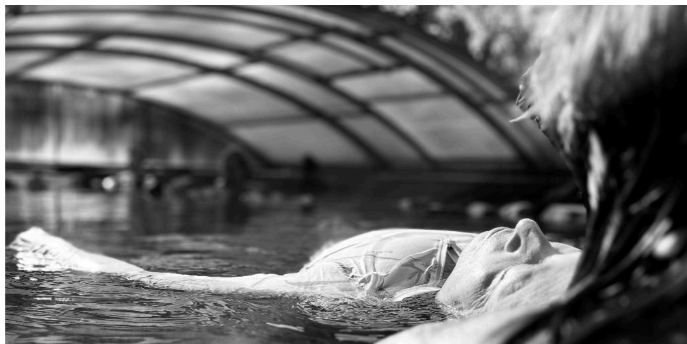
Dynamique stillness, aquatic fulcrum, et état modifié de conscience