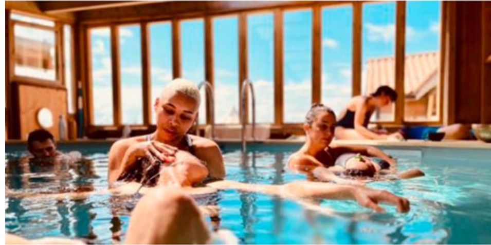
Dynamique stillness, aquatic fulcrum, et état modifié de conscience

In osteopatia, ascoltare, guardare e toccare il paziente fornisce informazioni su ciò che ha condotto alla sua situazione.